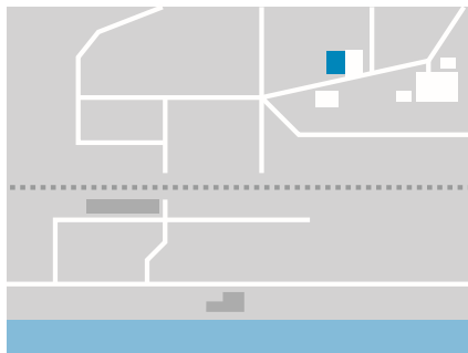
8810 Horgen T 044