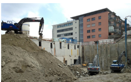
Aushubarbeiten Erweiterungsbau, April 2018

Der Bezug des Erweiterungsbaus wird im Jahr 2020 stattfinden. Anschliessend muss das heutige Schulhaus in Horgen saniert werden.